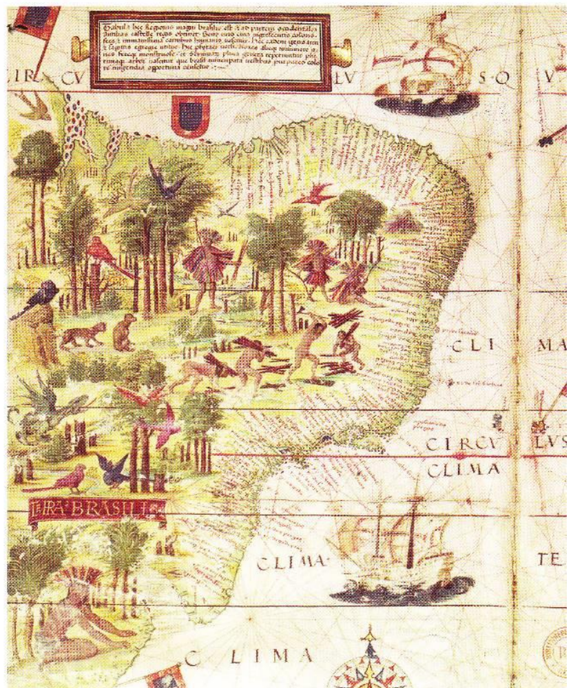
Carte du Brésil, extraite de l'Atlas Miller réalisée par Pierre et Georges Reinel, Lopo Homem (cartographes) et Antoine de Hollande (miniaturiste), 1519.